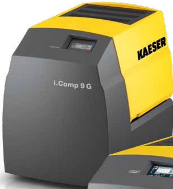
i.Comp 9 G