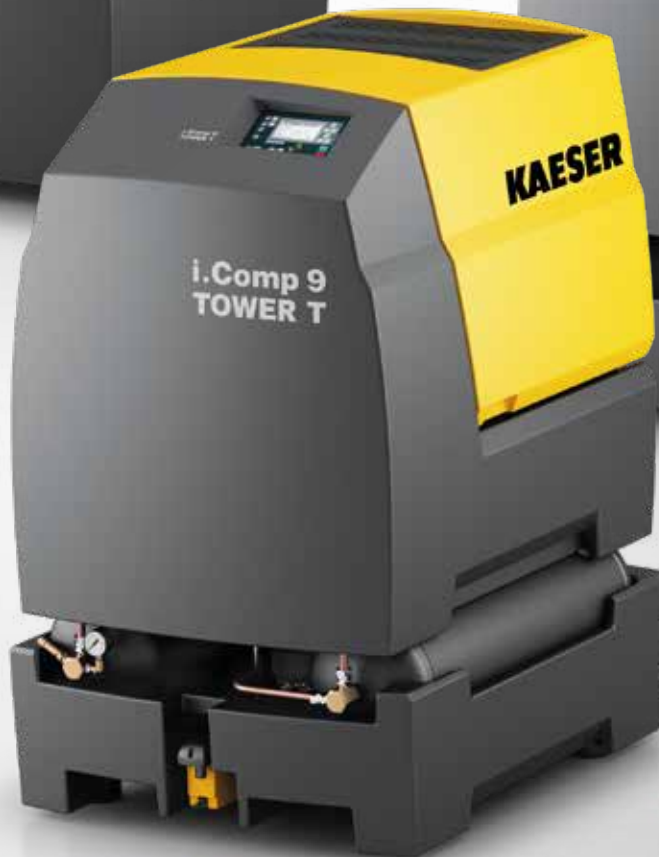
i.Comp 9 TOWER T