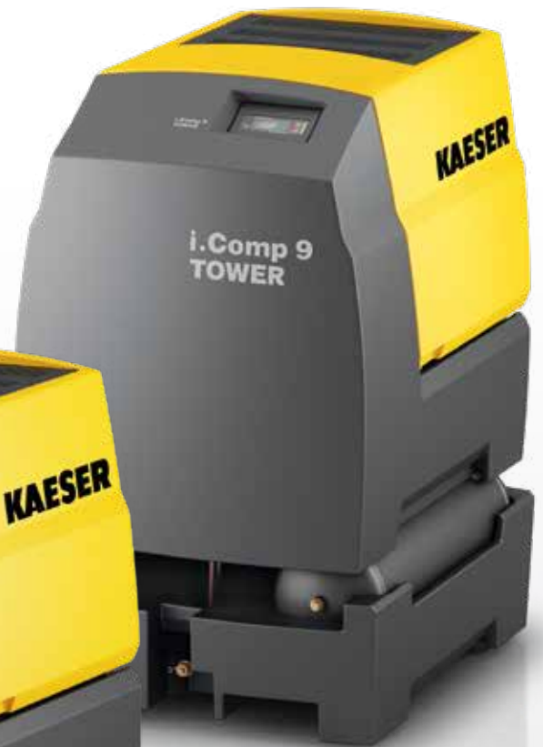
i.Comp 9 TOWER