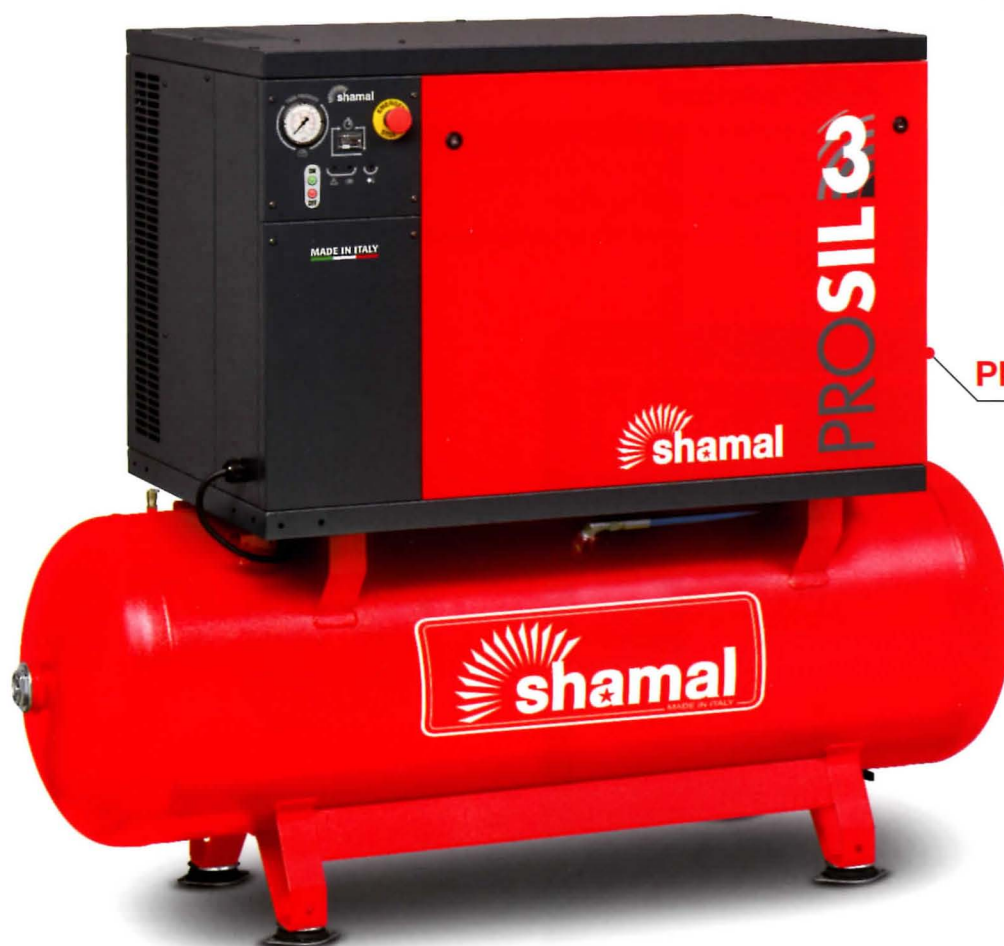
PROSIL K50/500 FT10