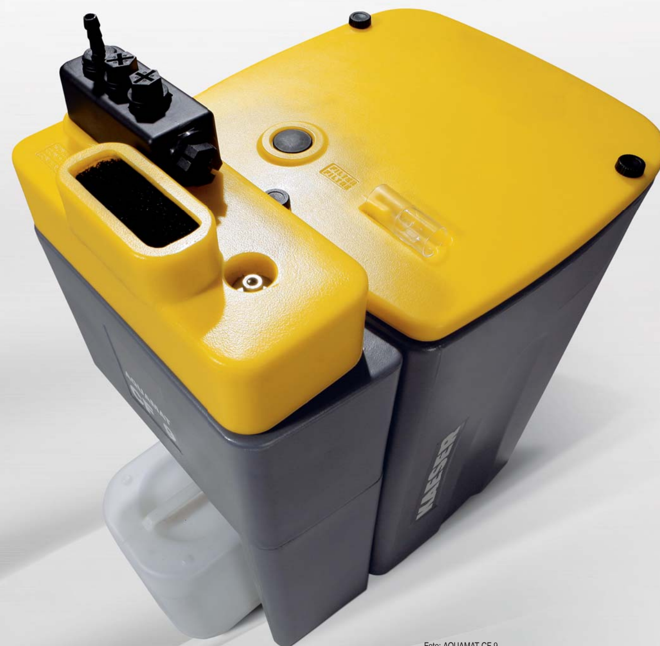
Foto: AQUAMAT CF 9